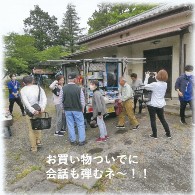
お買い物ついでに 会話が弾むネ～！！

ウエルシア薬局株式会社の移動販売車のことで、富士見市社会福祉協議会では、富士見市、ウエルシア薬局株式会社と協定を結び、食品・生活必需品・お薬・化粧品等の販売だけでなく、見守りや地域の皆様の通いの場づくり、コミュニティづくりのきっかけとなることを目指しています。