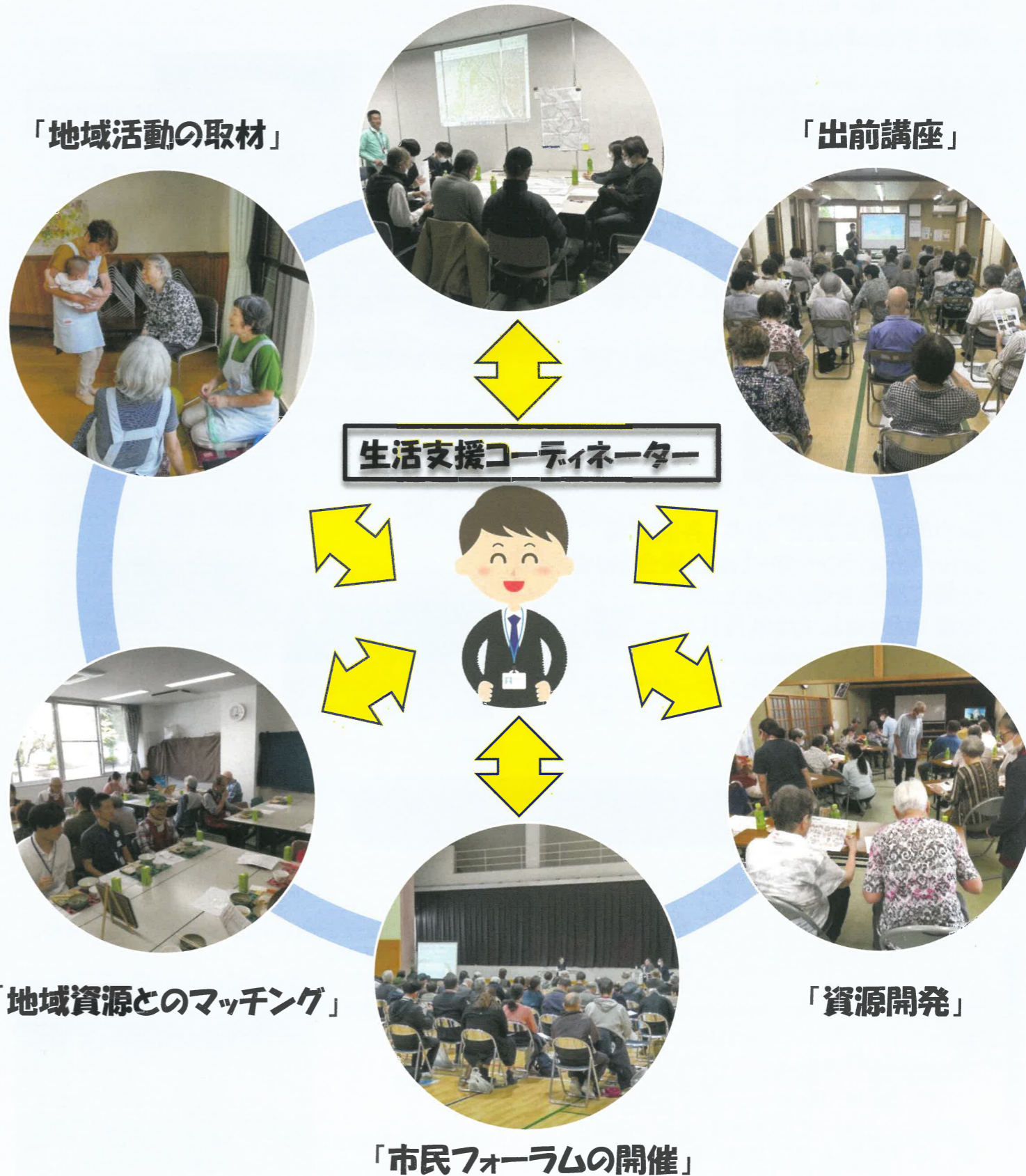
「地域資源とのマッチング」