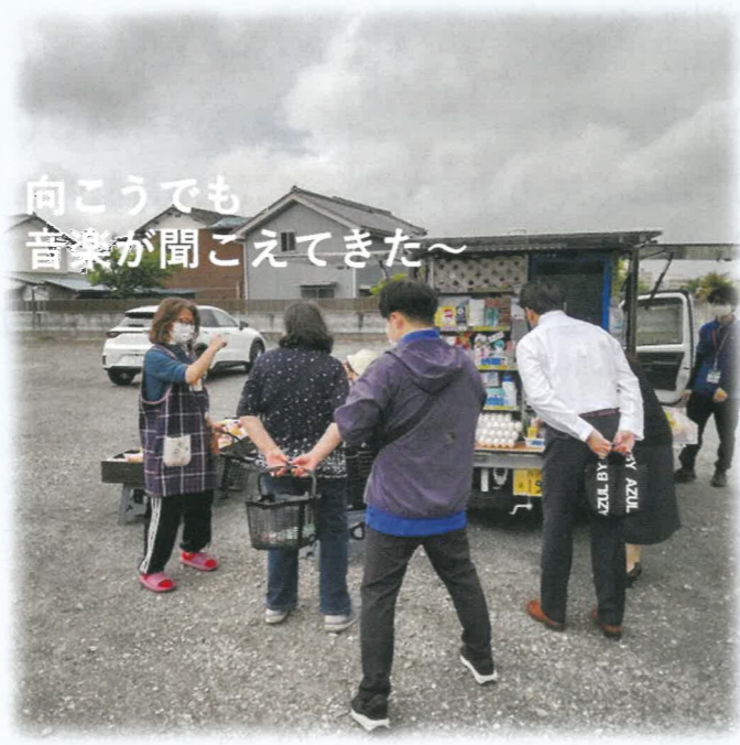
向こうでも 音楽が聞こえてきた～