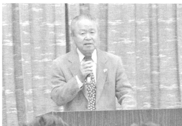
富士見市社会福祉協議会 大久保会長祝辞