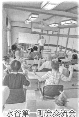
水谷第一町会交流会